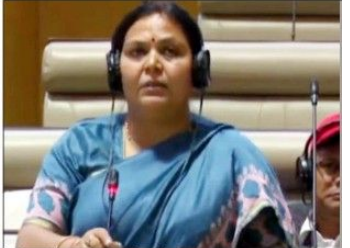
جدید بھارت نیوز سروس: ایوان میں وزیر دپیکا پانڈے نے اعلان کیا ہے کہ PESA قوانین کو ترمیمی شکل دی جا رہی ہے۔ اس میں کوشش کی جا رہی ہے کہ قانون کے تحت تمام لوگوں کو مساوی طور پر مواقع فراہم کیے جاسکیں۔