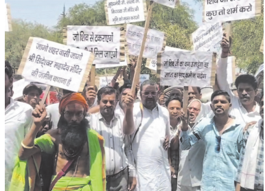
स्थानीय लोगों का कहना है कि पुराने शासकीय दस्तावेजों में भी इस मंदिर और वृक्षों का उल्लेख है। हिंदू संगठनों का कहना है कि यह मुंगवली का एकमात्र ऐसा स्थान है जहां कथा, भागवत,

अशोकनगर, ईएमएस। जिले के मुंगवली में हिंदू संगठनों ने मंगलवार को विरोध प्रदर्शन किया। संगठन के सदस्यों ने एसडीएम के माध्यम से मुख्यमंत्री को ज्ञापन सौंपा।