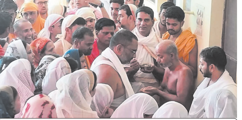
आज मनाया जाएगा जन्म कल्याणक बुधवार को भगवान का जन्म कल्याणक होगा। उसके अंतर्गत सुबह नित्य अभिषेक पूजन के बाद जन्म का दृश्य प्रस्तुत किया जाएगा।

खरगोन, ईएमएस। पावागिरी सिद्ध क्षेत्र ऊन में चल रहे जिन बिंब पंच कल्याणक महामहोत्सव के दूसरे दिन गंध कल्याणक मनाया गया।