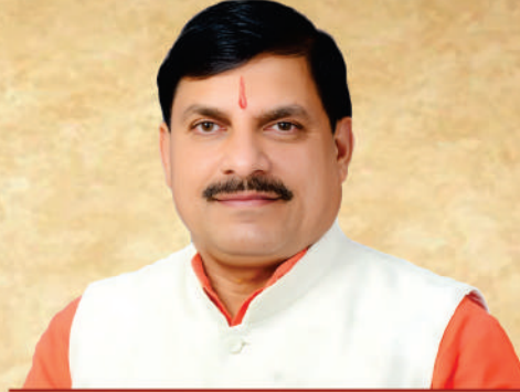
डॉ. मोहन यादव मुख्यमंत्री, मध्यप्रदेश