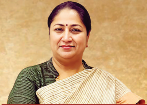
श्रीमती रेखा गुप्ता, मुख्यमंत्री, दिल्ली स्वागताध्यक्ष